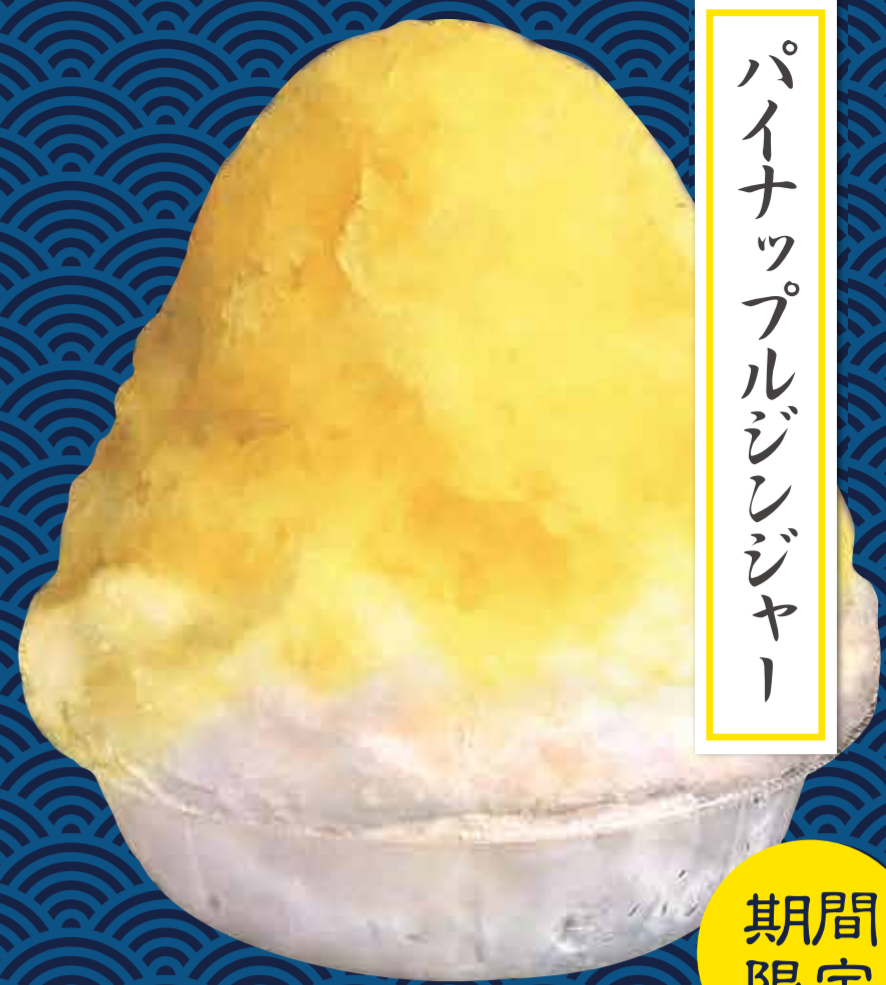
パイナップルジンジャー

¥600 (税込) ※練乳がけはプラス50円 若草山のような鮮やかな緑色をした上質な抹茶蜜。濃厚で上品な味わいをお楽しみください。