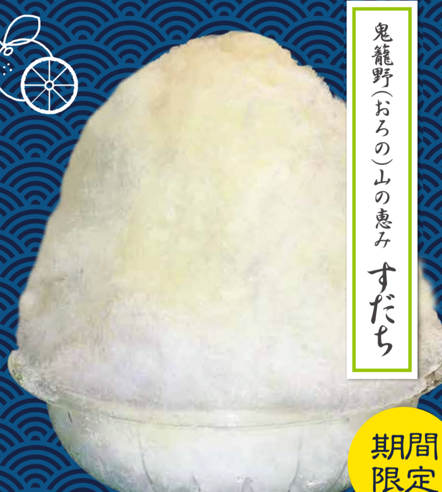
鬼龍野(おろの)山の恵みすだち

¥600 (税込) ※練乳がけはプラス50円 日本産紅茶の上質な部分を贅沢に使用した蜜が芳醇な香りを、口の中いっぱいに広がります。