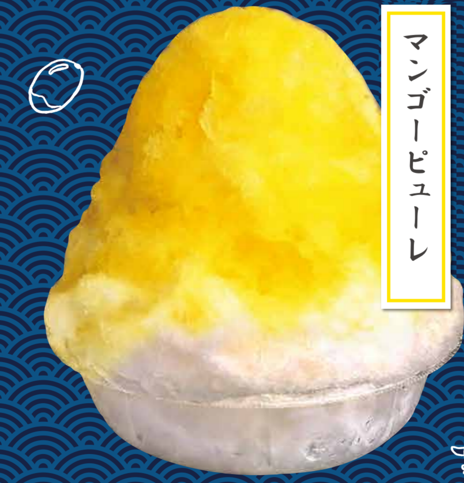
マンゴーピュール

¥500 (税込) ※練乳がけはプラス50円 ベータカロテンがたっぷりのパッションフルーツ。美しくなるための必須アイテム。