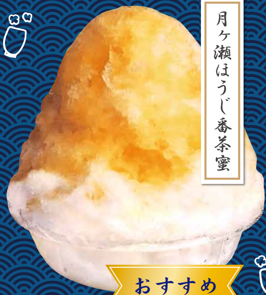
月ヶ瀬ほうじ番茶蜜