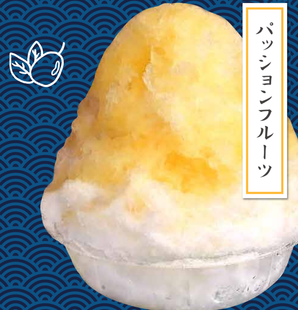
パッションフルーツ

¥600 (税込) ※練乳がけはプラス50円 すだち発祥の地、徳島県鬼龍野(おろの)地区の山で採れたすだちを贅沢に使用。ちよっとオトナのほろにがシロップです。